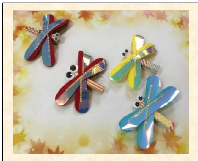
ケアサービス デイサービスセンター西六郷