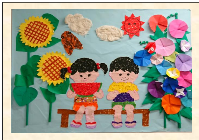
デイホームゆりの木大田

表紙絵は、デイホームゆりの木大田、ケアサービス デイサービスセンター七辻、ケアサービス デイサービスセンター西六郷から寄せられたご利用者の作品です。