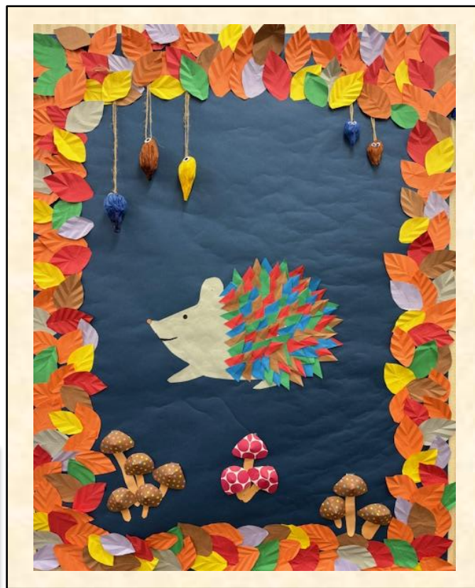
ケアサービス デイサービスセンター七辻