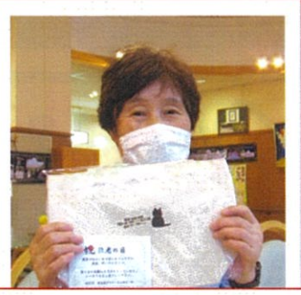
お祝いのお品はトートバッグです