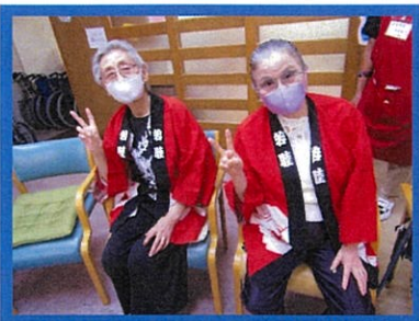
(おまつりWEEKより) 好日苑 デイサービスセンター

おまつりWEEKは、『曜日別対抗魚釣り大会』です。どの曜日も大魚で大接戦でした!