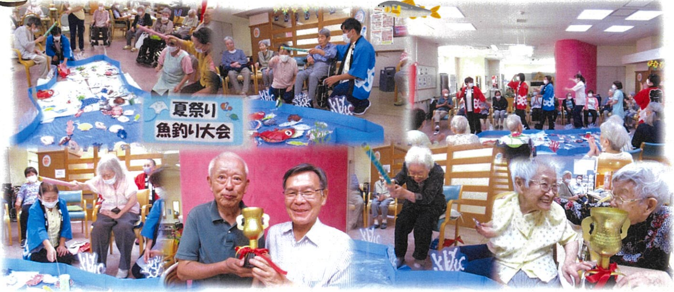
夏祭り 魚釣り大会