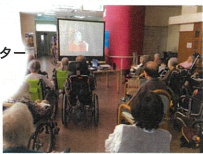
往年のスター 観賞中