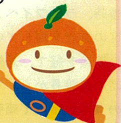
和の輪イメージキャラクター wanowa チャン

10/1・11/5・12/3 雪谷特別出張所にて開催予定 是非ご参加ください。要予約。