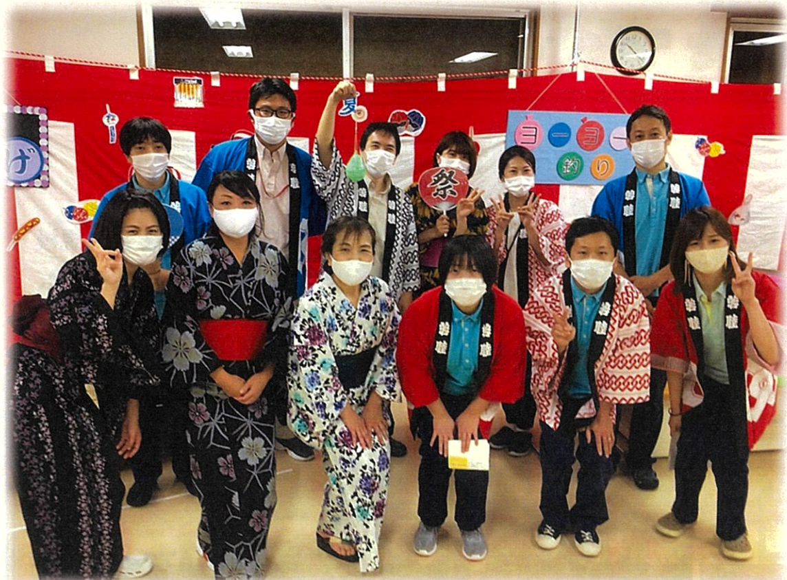
好日苑の夏まつりより